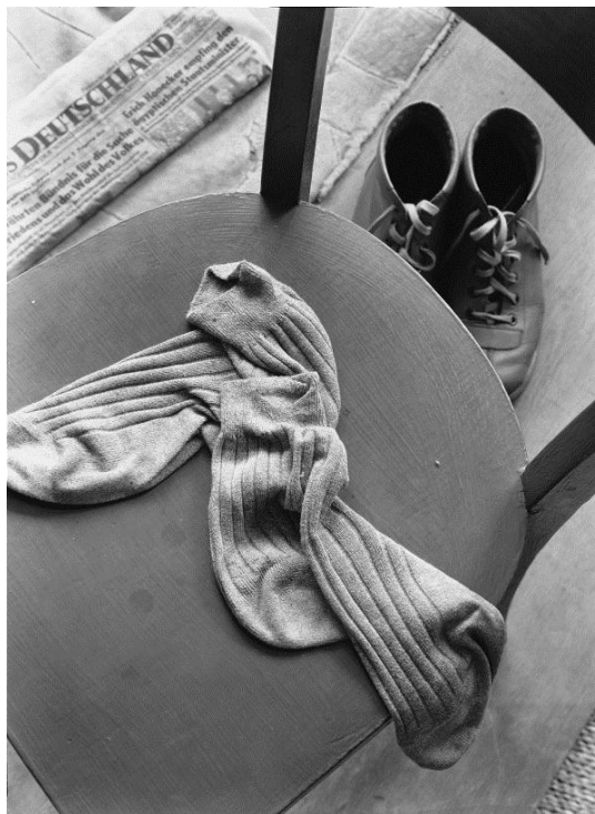
Manfred Paul – Socken Silber Gelatine Print, 1985 Edition 2/9 20 x 24 (30 x 40), © Manfred Paul