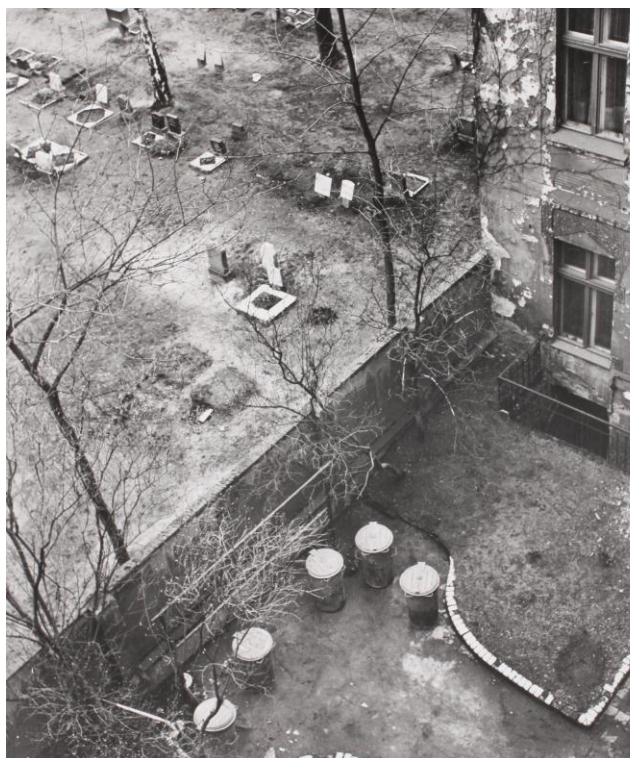
Manfred Paul - Hinterhof/Friedhof/Lychener Straße Berlin, 1979, Silbergelatineabzug, printed 1979 20 x 24 (30 x 40)

wir freuen uns, Ihnen hiermit die Verlängerung unserer Ausstellung „Manfred Paul – Berlin Nordost“ mitzuteilen. Aufgrund des gestiegenen Interesses beim Publikum zeigen wir die Zusammenstellung der drei Werkzyklen des Berliner Fotografen aus den Jahren 1970 – 1990 noch bis zum 6. Juli.