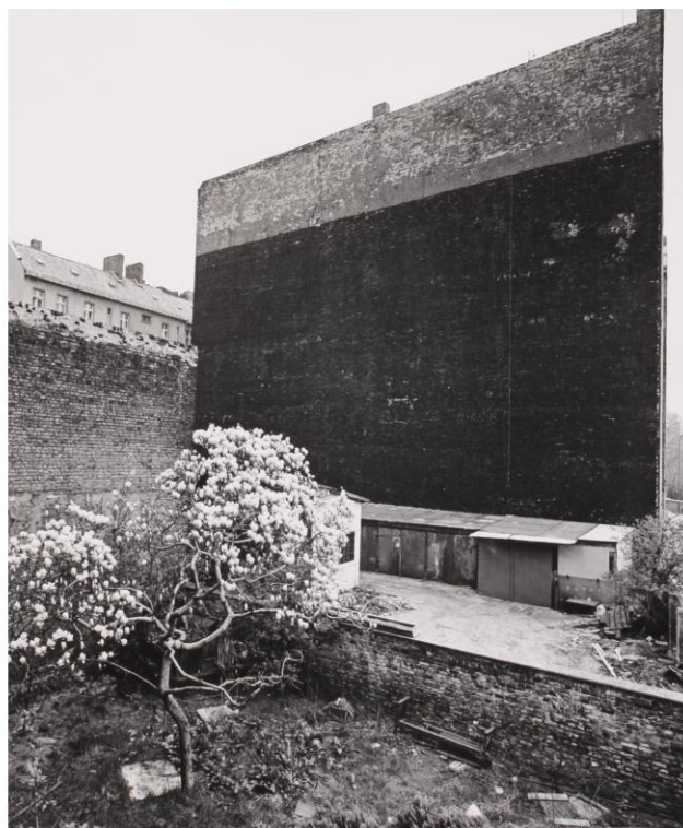
Manfred Paul - Brandmauer am S-Bahnhof Schönhauser Alle Berlin, 1979, Silbergelatineabzug, printed 1979 20 x 24 (30 x 40), © Manfred Paul

Seit dem 25. Januar 2013 präsentiert die Collection Regard in ihren drei Räumen die wesentlichen Werkzyklen des Berliner Fotografen Manfred Paul aus den Jahren 1970 – 2006. Die Zyklen umfassen Fotografien von Ostberliner Straßenzügen und Hinterhöfen aus den 70er/ 80er Jahren in Berlin Nordost/ Prenzlauer Berg sowie einige fotografische Porträts junger Erwachsener aus dieser Zeit. Mit seinen nicht inszenierten Stillleben wird ein weiterer wichtiger Schwerpunkt seiner Arbeit bis heute vorgestellt. Mit dieser fotografischen Position zeigt der Sammler Marc Barbey erneut einen Fotografen, den es in seiner Vielfalt und Einzigartigkeit neu zu entdecken gilt.