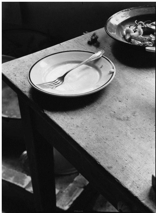
Manfred Paul – Teller mit Gabel Silber Gelatine Print, 1983 Edition 2/9 20 x 24 (30 x 40)

Anlässlich der Ausstellung bringt die Collection Regard eine limitierte Edition von Fotografien mit je drei Motiven der Stillleben und Berlin Nordost heraus. Die nummerierte Auflage erscheint in einer Höhe von 9 Exemplaren. Die Abzüge sind von Manfred Paul hergestellt, gestempelt, nummeriert und signiert, und exklusiv in der Collection Regard erhältlich.